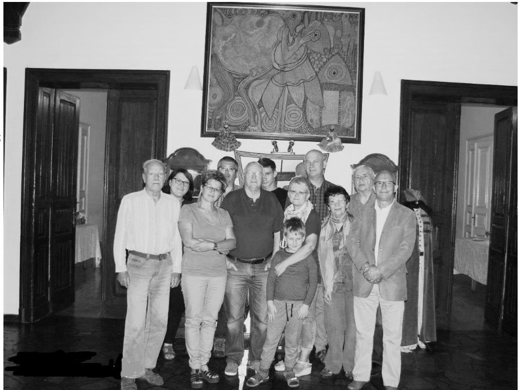
Uczestnicy Zjazdu w holu pałacu w Brodnicy śremskiej

X. Ledwo przyjechałem z „chaty” W szachach miałem już dwa maty Tak na moje powitanie Młodszy Junior dał mi lanie.