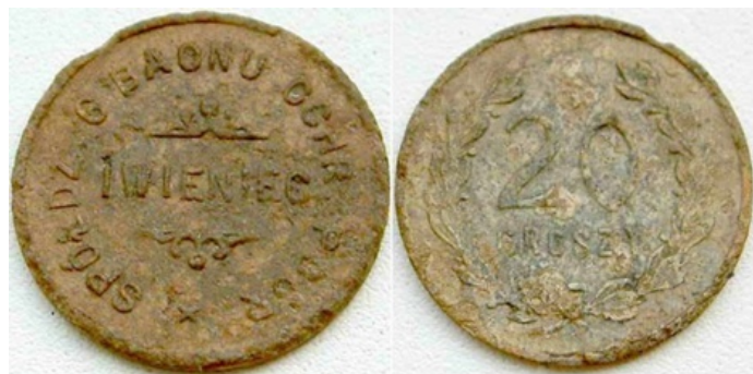
Marka kredytowa - 20 groszy - Spółdzielnia 6 Baonu Ochrony Pogranicza – Iwieńc.

Według informacji w książce poświęconej pamięci rejonu wołyńskiego dotyczącego Spółdzielni Batalionu Korpusu