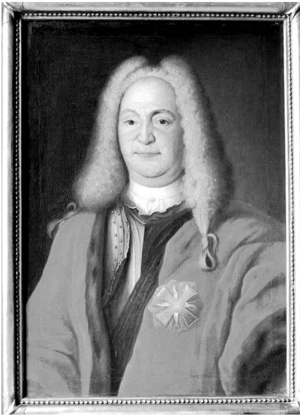
Jan Ursyn Dowoyna Sołłohub, Podskarbi Wlk. Litewski, portret z ok. 1740 r. w Muzeum-Zamku w Oporowie

Po roczkach juliowych [czyli w lipcu 1838 r.] znowu pobiegłem do Wilna dla spraw adwersarzów naszych... Jadąc do Wilna, trafiłem w grodzieńskim powiecie w Nowym Dworze na ślub Sołłohuba podskarbiego wielkiego litewskiego z Ogińską wojewodzanką wileńską najstarszą, z której okazji przychodzi mi o tymże Sołłohubie nadmienić.