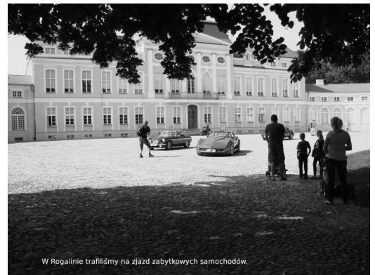
W Rogalinie trafiliśmy na zjazd zabytkowych samochodów.